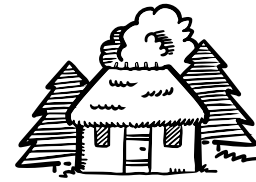
chatka w lesie

Ten Pułkownik to piękna dziewczyna, bohaterka, Litwinka – Emilia Plater.